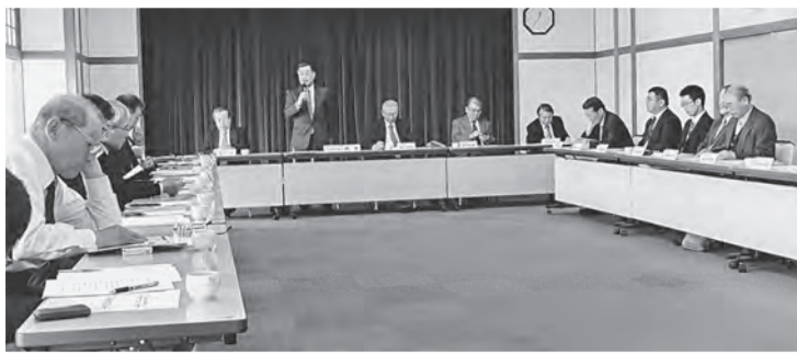
新たなビジネスモデルへの転換を目指すことを確認した理事・総務委員会合同会議

同石商協は、役割を担っており、地産物産を振興する役割を担っており、地域インフラ強化の推進に貢献したいと考えている。また、地産物産の振興に貢献したいと考えている。また、地産物産の振興に貢献したいと考えている。