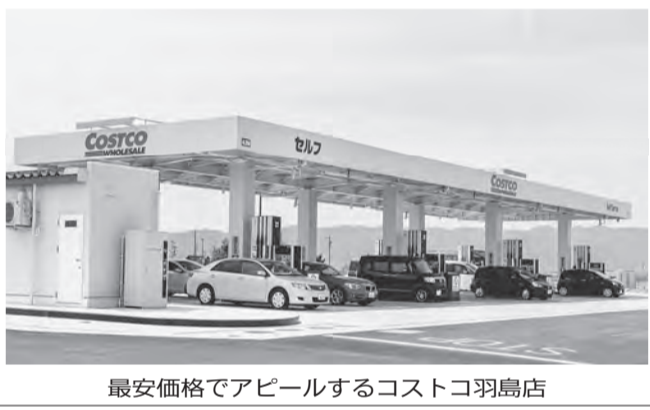
最安価格でアピールするコストコ羽島店

昨秋のコストコSS進出以来、岐阜県下最安の激戦地となっていた羽島市で、地元SSが販売競争の影響を受けて、ついに店を閉じた。その一方でコストコ周辺の大手4社SSは、店舗改装や各種サービスの大幅な値上げに乗り出すなど、全面対決の姿勢を崩しておらず、羽島を震源地とする市場の悪化は広がりを見せるばかりだ。