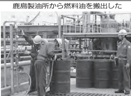
鹿嶋製油所から燃料油を搬出した