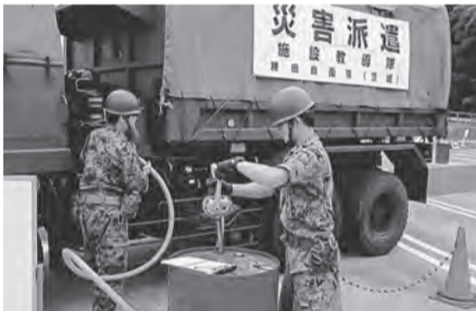
守谷P A内では供給訓練も行われた

関東経済産業局と陸自備前施設学校は、合同災害対応訓練を実施した。南海トラフ地震の影響で民間ローリーが使用不可能となったことを前提条件として、自衛隊が直接製油所から仮設SSまで石油製品の運搬や供給を実施した。その後、こうした訓練を通じて、災害時における石油製品供給体制の手順確立を目指している。