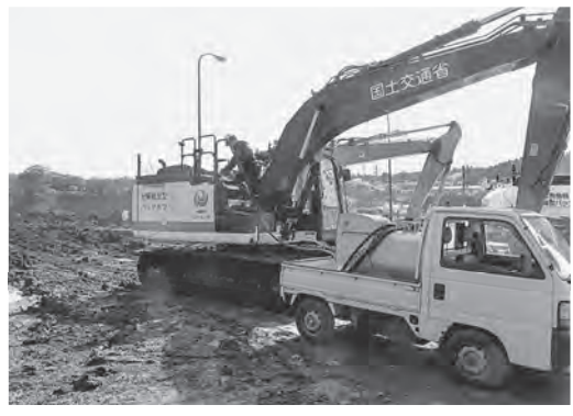
被災地に出動した車両に給油する小型ローリー

直後から国土交通省は河川の被災状況を調査、技術支援、地滑りや急傾斜などの危険箇所を調査し、創設以来初めて全国のトラック・フォース(緊急災害対策派遣隊)が被災地へ派遣された。熊本地震では、創設以来初めて北海道から沖繩まで全国から計440人が集結した。 熊本地震では、創設以来初めて北海道から沖繩まで全国から計440人が集結した。 熊本地震では、創設以来初めて北海道から沖繩まで全国から計440人が集結した。